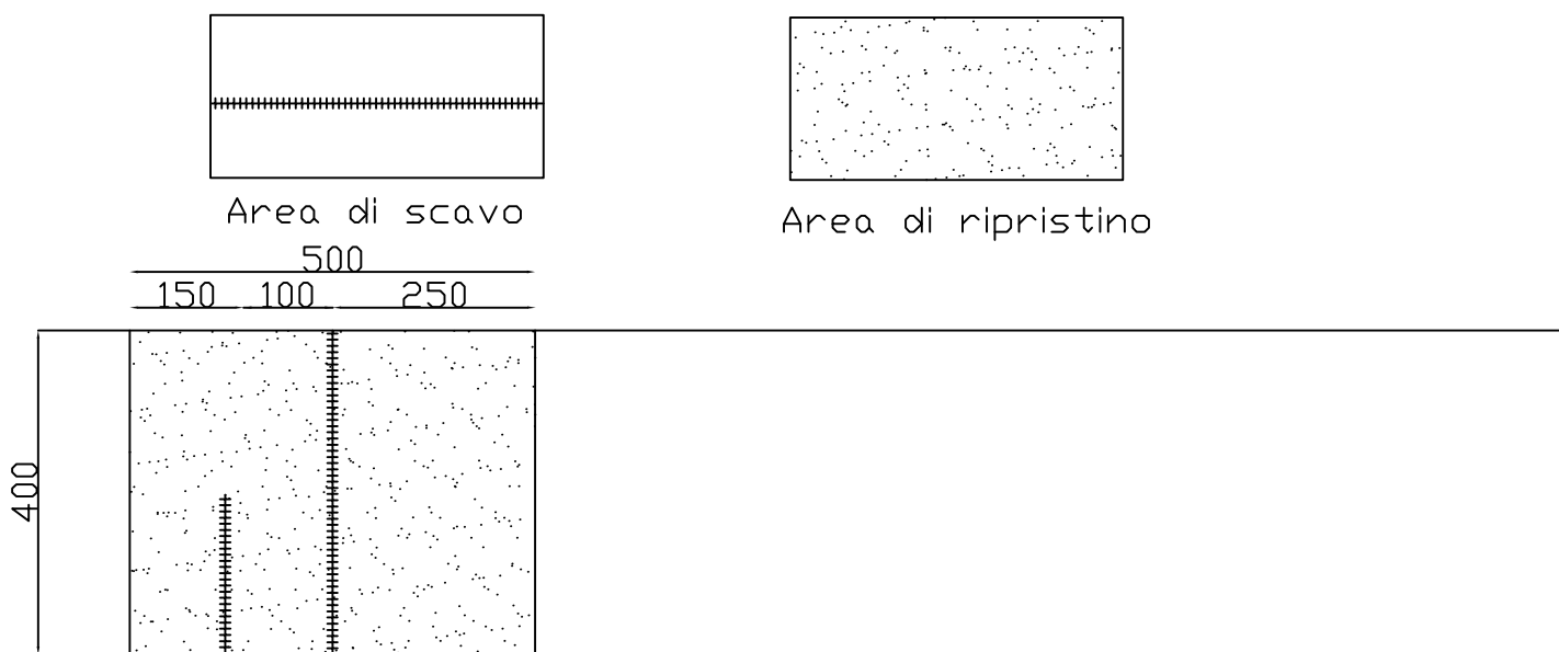
Fig. 4 - Doppio scavo trasversale alla carreggiata